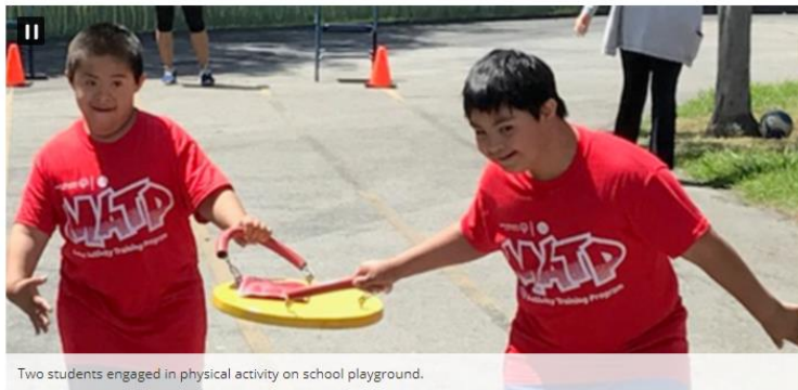
Two students engaged in physical activity on school playground.